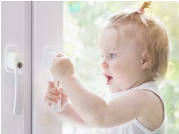
Abschließbare, möglichst gleichschließende Fenstergriffe dienen vor allem der Kindersicherung.

Bedienbarkeit: Mit Griffen, die gut in der Hand liegen, optisch leicht erkennbar und gut erreichbar sind, lassen sich Fenster besser bedienen. Abhängig von der Fenstergröße und dem gewählten Beschlag können die Griffen ohne Mehrkosten im unteren Drittel des Fensters angebracht werden. Die Mechanik sollte leichtgängig und mit geringem Kraftaufwand bedienbar sein – unabhängig von der Öffnungsart. Bei schwer zugänglichen Fenstern kann es sinnvoll sein, wenn sie elektrisch geöffnet und geschlossen werden können.