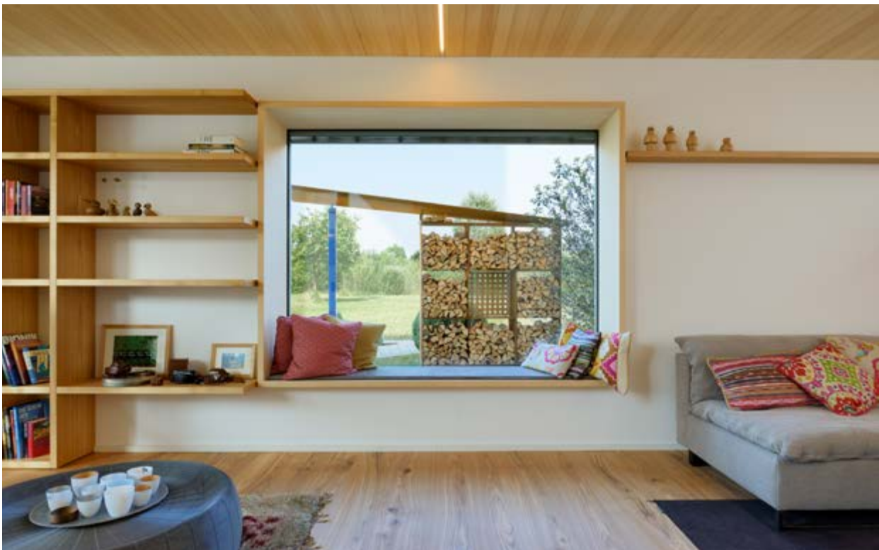
Neue Fensterformate können zur Neugestaltung der Fassade beitragen. Sie können für mehr Licht, mehr Kommunikation mit der Außenwelt und für neue Wohnerlebnisse sorgen und wie bei diesem Sitzfenster ein gemütlicher Rückzugsort sein.

Fensterbeschläge: Die Beschläge sollten zu den Anforderungen im jeweiligen Raum passen, z.B. müssen nicht alle Fenster mit Dreh-Kipp-Beschlägen versehen sein. Alle Beschläge sollten den einbruchhemmenden Widerstandsklassen RC2 bzw. RC3 entsprechen.