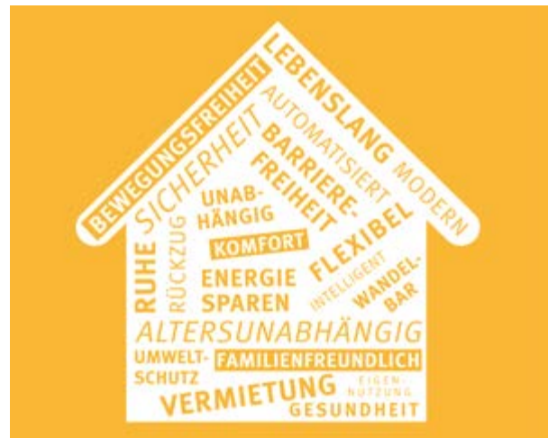
Wichtige Aspekte beim Wohnen

Familiäre Änderungen: Kleine Kinder suchen eher die Nähe der Erwachsenen, Jugendliche brauchen mehr Privatsphäre. Auch die erwachsenen Familienmit-