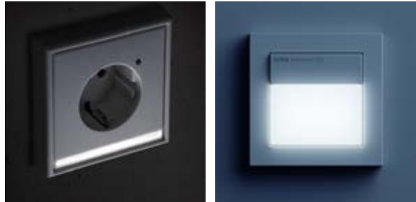
Orientierungsleuchten: links in Verbindung mit einer Steckdose, rechts aktiviert über einen Bewegungsmelder.

Orientierungsleuchten unauffällig den Weg und können helfen, Unfälle zu vermeiden. Bei Bedarf ist die Notbeleuchtung auch in Kombination mit einem Bewegungsmelder erhältlich.