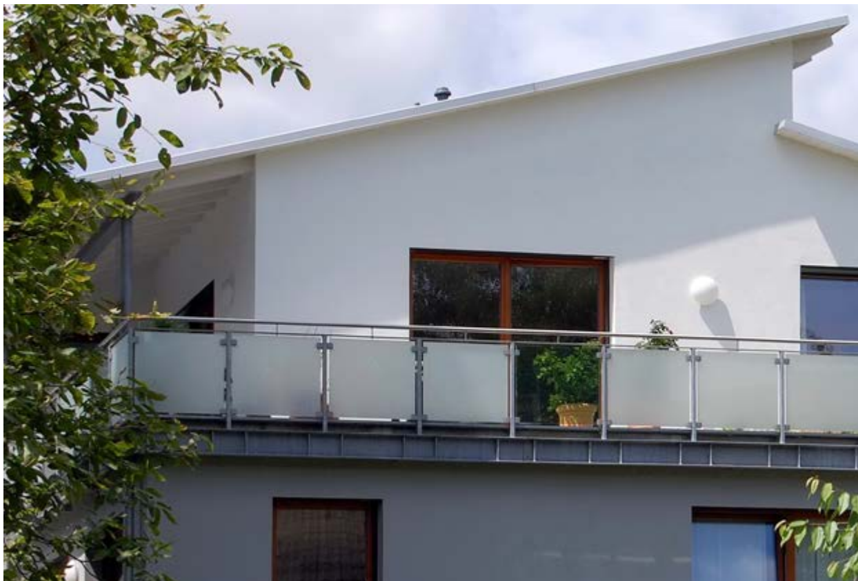
Ein großer Dachüberstand durch ein zurückgesetztes, aufgestocktes Dachgeschoss sorgt auf der Dachterrasse für einen baulichen Sonnenschutz. Transparente Brüstungselemente gewähren Ausblicke, wo sie gewünscht sind.

Balkontür: Sie sollte ebenso wie die Fenster dicht schließen, wärmeschutzverglast und leicht bedienbar sein, gut vor Einbruch schützen und, wenn möglich, auf 90 bis 100 cm verbreitert werden.