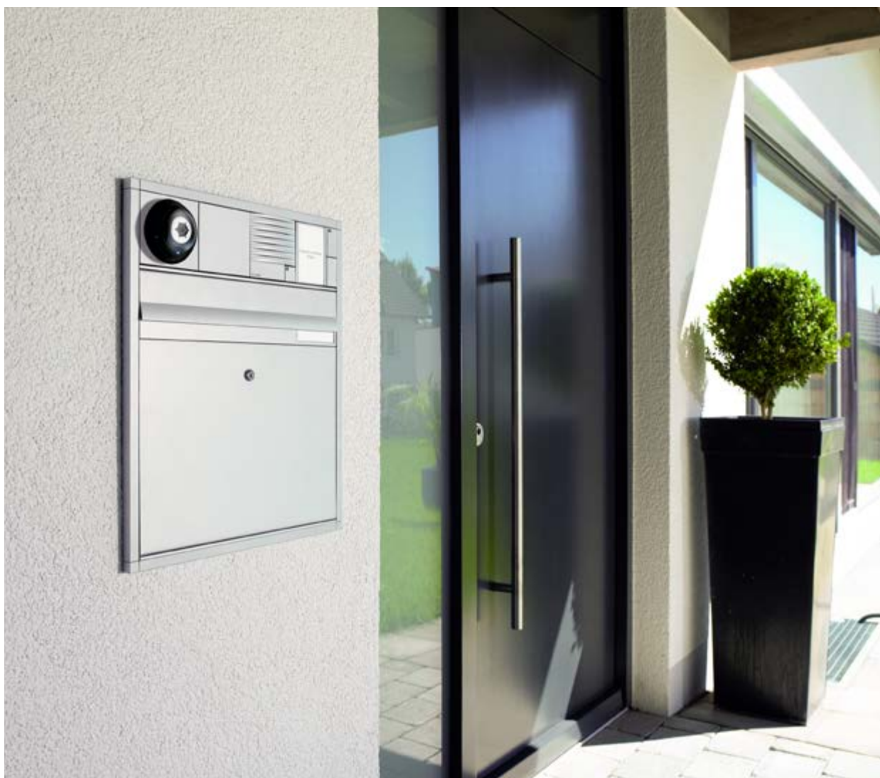
Dieser Hauseingang bietet Schutz vor Wind und Wetter und gewährt allen einen bequemen Zugang.

Zugang: Ein Höhenanstieg zum Haus lässt sich meist durch eine Rampe (möglichst nur bis 6 Prozent Gefälle) ausgleichen, die mit Kinderwagen, Einkaufskarren oder Rollator gleichermaßen bequem nutzbar ist. Ist eine Treppe aber erwünscht oder erforderlich, sind beidseitige Handläufe für Sie und Ihre Gäste bei jeder Tages- und Nachtzeit und bei jedem Wetter nützlich. Ergänzend zur Treppe können bei Bedarf unterschiedliche Liftsysteme, sichtbar oder versenkbar Höhenunterschiede ausgleichen und einen ebenen Zugang schaffen.