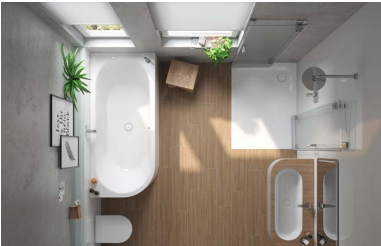
Mehr Bewegungsspielraum lässt sich im Bad durch eine geschickte Anordnung von Dusche, Badewanne, Waschtisch und WC gewinnen.

Badkeramik für Groß und Klein: Soll der Standort von WC und/oder Waschtisch beim Austausch beibehalten werden, lassen sich ein neues WC und ein neuer Waschtisch als Vorwandblock einfach montieren. Höhenverstellbare Objekte eignen sich für große und kleine Menschen gleichermaßen und können sitzend oder stehend genutzt werden.