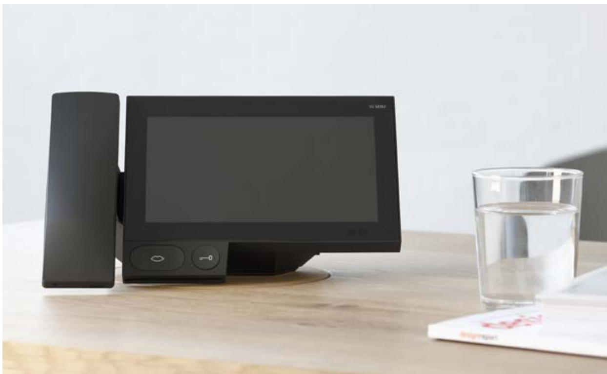
Heizung, Strom, Türkommunikation, Fenster oder Licht lassen sich über festinstallierte oder mobile Geräte oder per Sprachsteuerung regeln.

www.gerontotechnik.de www.smarthome-deutschland.de www.fertigbau.de