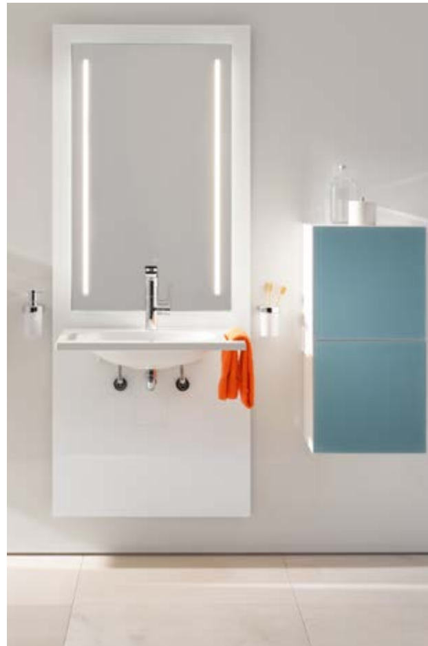
Ein höhenverstellbares WC und ein höhenverstellbarer, gut ausgeleuchteter Waschtisch sorgen für Bequemlichkeit im Bad. Bei kleinen Bädern kann eine begehbare Raumspar-Kombi-Wanne mit fast ebenem Zutritt eine gute Lösung sein.

Die Montage eines Spiegels knapp oberhalb des Waschtisches in ausreichender Länge erlaubt einen Blick auf Augenhöhe im Stehen und im Sitzen.